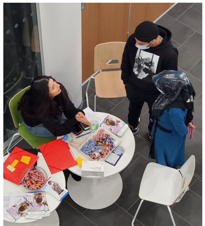
Oppilaitosvierailu Oulussa.

https://www.turku.fi/uutinen/2022-02-03_monikielinen-hanke-tarjoaa-koronatietaa-omalla-aidinkielella