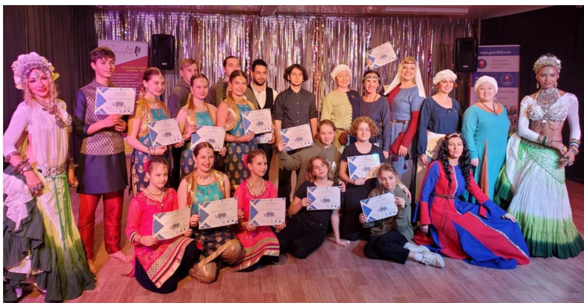
Graniitti-toimintakeskuksen monikulttuurisen illan järjestäjiä, osallistujia ja esiintyjä.