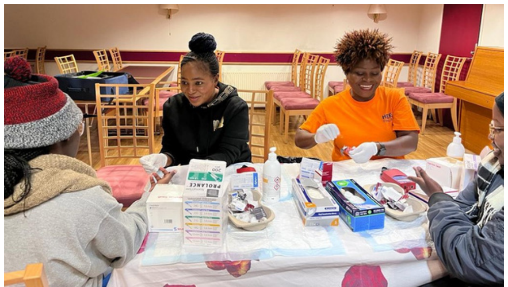
HEED Association Finlandin terveysillan hemoglobiiniarvonsa.

Infoillan osallistujilla oli myös mahdollisuus tarkistaa heidän hemoglobiiniarvonsa ja keskustella aiheesta kun paikalla oli kokeneita hoitajia vastailemassa osallistujien kysymykseen.