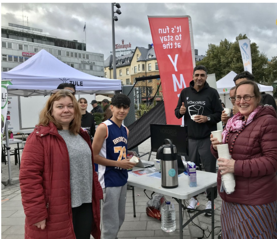
Viro-keskus Mahdollisuuksien torilla yhdessä ukrainalaisten kanssa.